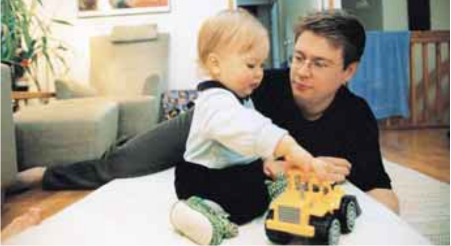
Markuu ilmuhu dhasho ka dib Finland aabbayaashu 1-3 toddobaad oo fasaxa aabbaha ah ayey qaadan karaan si ay ilmaha u hayaan. Qiyaastii 60% aabbayaasha ka mid ahi waxay qaataan fasaxa aabbaha ee ay xaqa u leeyihiin.